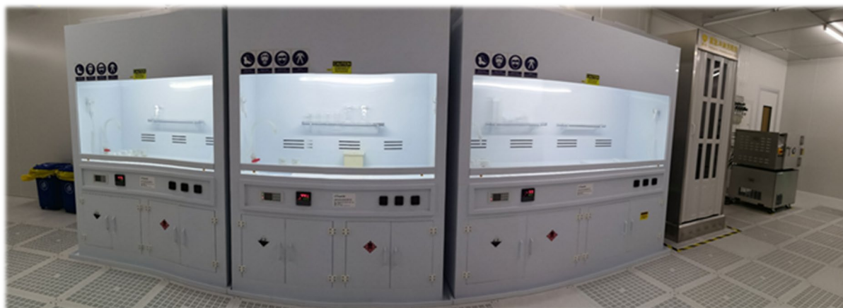
图 8 通风橱位置 (右一)