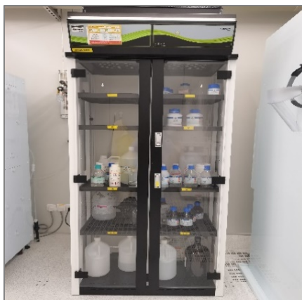
图 3 化学药品存储柜