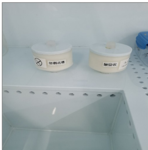
图 6 废液回收槽