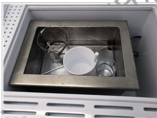
图 11 通风橱超声清洗机