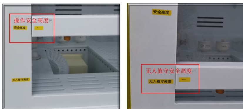
图 5 通风橱面板的规范高度