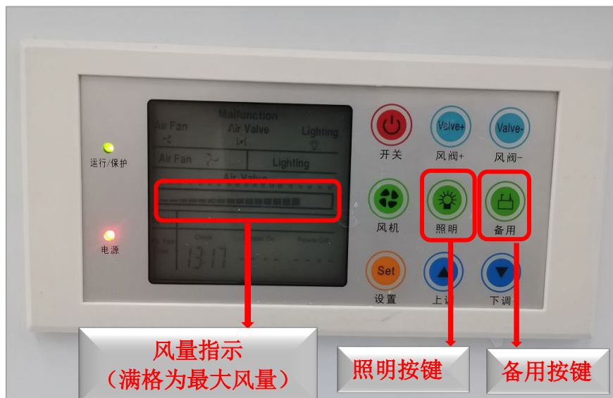
图 10 操作界面图片