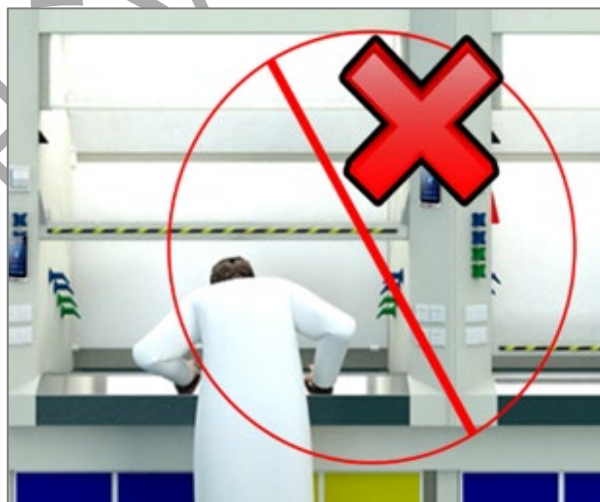
图 2 安全距离及禁止的危险行为