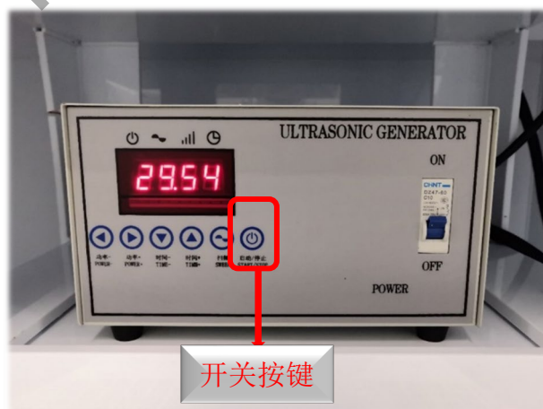
图 12 通风橱超声清洗机面板