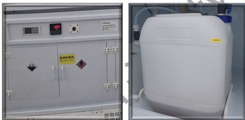
图 7 通风橱下方酸废液桶位置