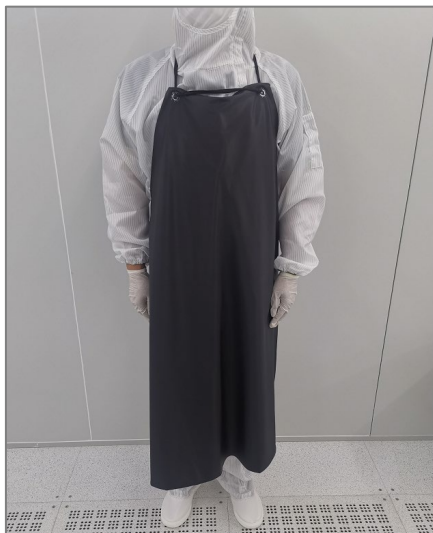
图 1 使用酸处理样品所需的防护装备